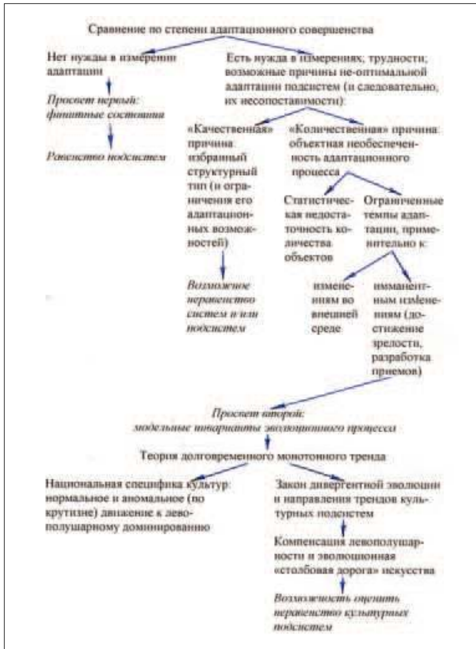
Рис. 1. Логическая схема анализа: возможности сопоставления культурных подсистем